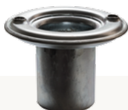
لوازم و قطعات سفارشی

پکصا ارائه کننده انواع کیسه فیلتر از جنس پلی استر، متآراماید (نومکس)، پلی پروپیلن، فایبرگلاس و با تکمیل کاری ضد آب و ضد روغن می باشد. سبد های فیلتر پکصا از جنس مسوار با پوشش رنگ الکترواستاتیک یا آبکاری گالوانیزه و نیز از استنلس استیل 304/316 قابل عرضه می باشد. ونتوری های پکصا وظیفه هدایت صحیح جریان هوای به داخل فیلتر و تولید پالس ضربه ای یکنواخت را بعهده دارد.