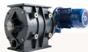
روتاری ولو ایرلاک

پکصا قادر به ساخت انواع فن های سانتریفیوژ با پروانه شعاعی، فوروارد و بک وارد می باشد. طراحی دقیق و مطابق با استاندارد بدنه و پروانه راندمان بالای فن را به ازای حداقل مصرف انرژی فراهم می آورد. استفاده از فن های داخلی در بگ فیلتر فضای مورد نیاز را به حداقل می رساند. همچنین در کاربری های خاص ارائه فن های فشار بالا تا 30 kPa امکان پذیر می باشد.