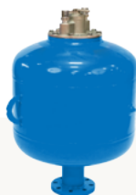
شوکر تخلیه مخزن

بهره گیری از تجهیزات نظارتی باعث بهبود عملکرد دستگاه، صرفه جویی در مصرف انرژی و افزایش طول عمر تجهیزات می شود. بهره گیری از سنسور فشار اختلافی برای کنترل شیرها به صرفه جویی در مصرف هوای فشرده و افزایش قابل ملاحظه عمر کیسه فیلترها کمک شایانی می نماید. بهره گیری از سنسور دما از افزایش بیش از حد مجاز دما و آسیب کیسه ها و شیرها جلوگیری می نماید.